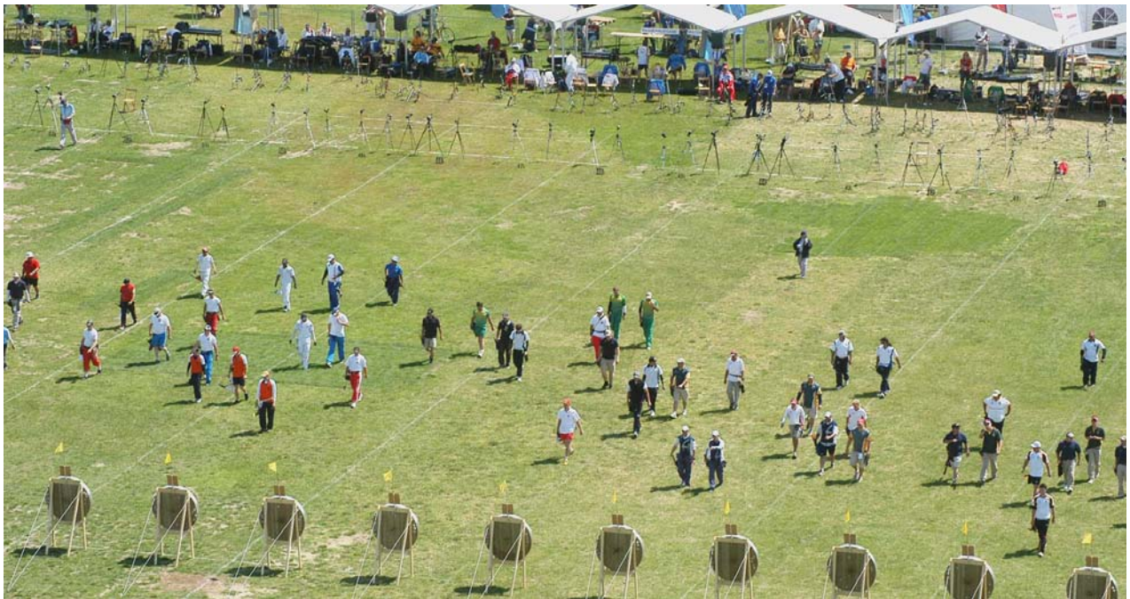
Bild Nr. 1.2.1 Offener Bogenplatz

Liegen mehrere Wettkampfbahnen nebeneinander, haben die seitlichen Abstände und die der Scheiben voneinander mindestens 2 m zu betragen.